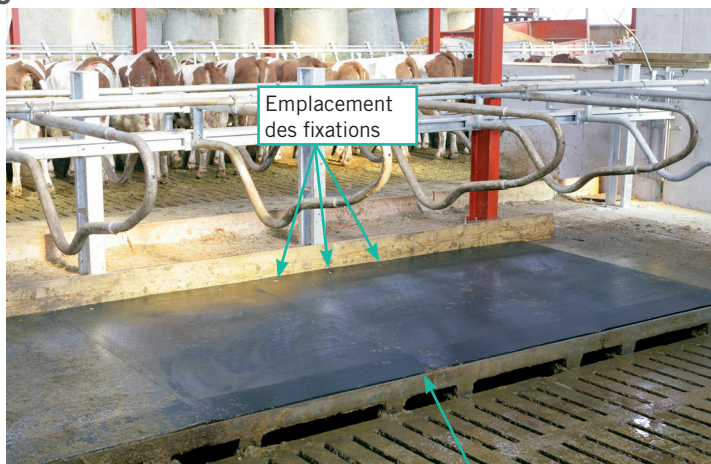
Emplacement des fixations

Si les présentes préconisations ne sont pas respectées, la garantie ne pourra pas être prise en compte.